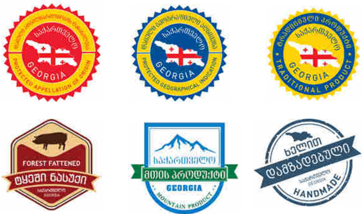
ფიგურა 7. ხარისხის ნიშნები საქართველოში

ქვემოთ მოცემულია ხარისხის ნიშნების გამოსახულებები: